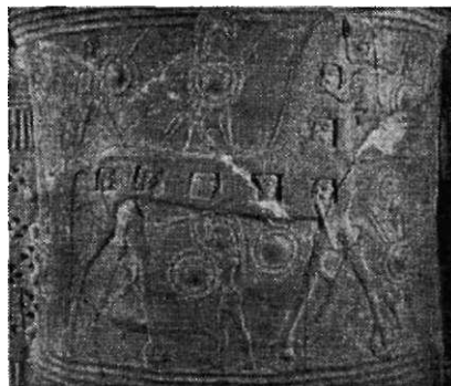
Зображення Троянського коня на фрагменті вазі з о. Міконос (перша половина VII ст. до н. е.)

Таким чином, стародавня общинна демократія наприкінці «темних віків» зазнала істотних змін. Реальна влада зосереджується